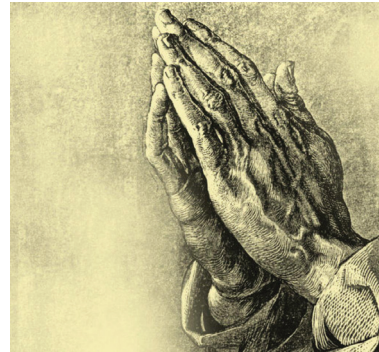
(Bild: Albrecht Dürer, 1471 - 1528)

Ökumenischer Gottesdienst zum Eidgnössischen Dank-, Buss- und Betttag in der römisch katholischen Kirche St. Martin in Uitikon am Sonntag, 19. September, 11:00 Uhr