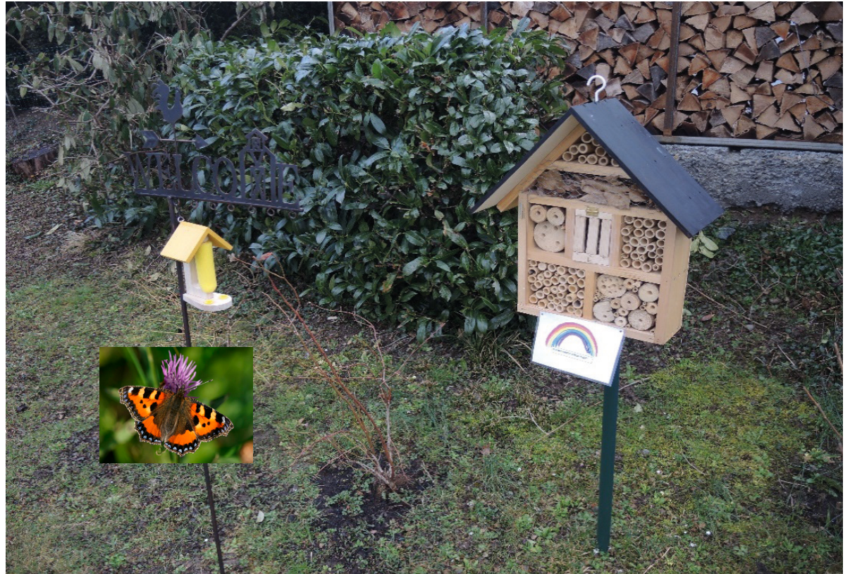
(Bild Schmetterling: Kleiner Fuchs)