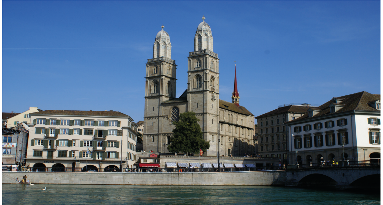
Grossmünster in Zürich. Hier hat 1519 alles angefangen